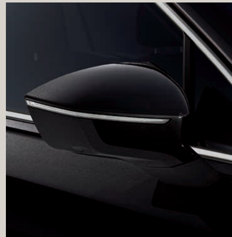
Černá Deep** St XE

Style St Xcellence XE Standardní výbava ■ Výbava na přání ■ *Nemetalický lak. **Metalický lak. ***Exkluzivní lak.