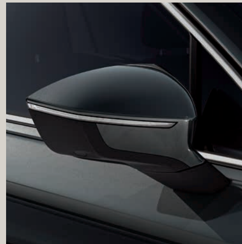
Zelená Dark Camouflage*** St XE