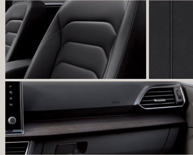
Černá kůže Vienna