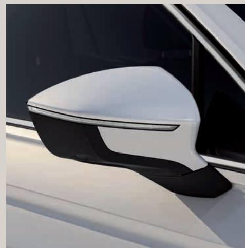
Bílá Oryx*** St XE