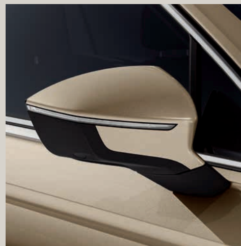
Béžová Titanium** St XE