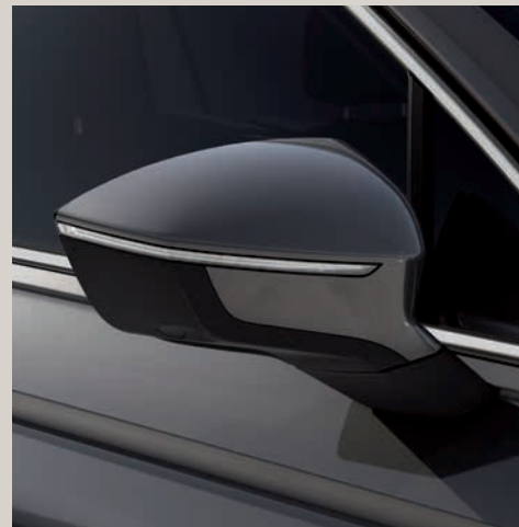
Šedá Urano* St XE