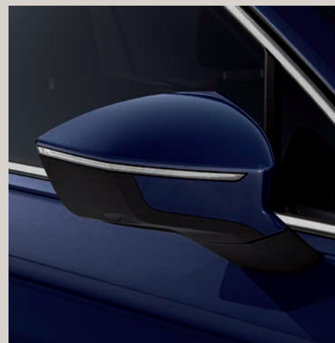
Modrá Atlantic** St XE