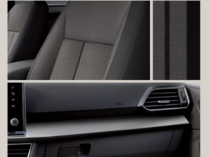
Tkanina Olot s ozdobnými plochami z černého materiálu Alcantara®