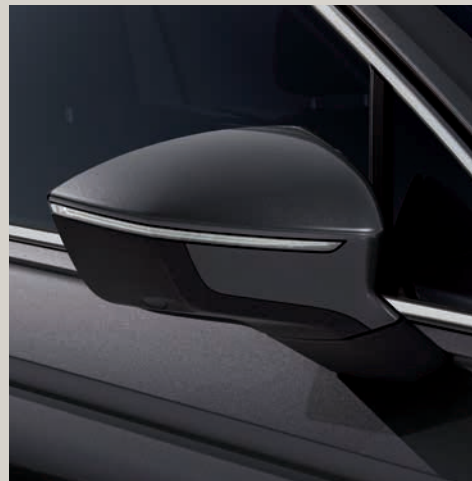
Šedá Indium** St XE