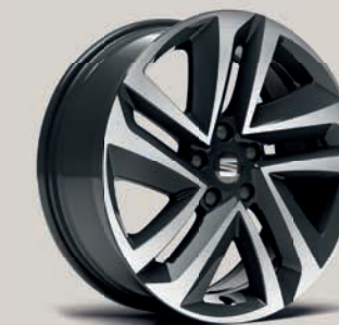
Broušená 18" kola Performance