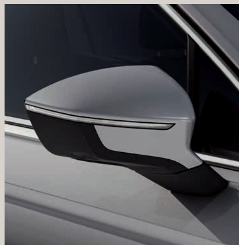
Stříbrná Reflex** St XE