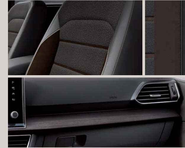
Tkanina Baza/Alcantara® / umělá kůže Bison