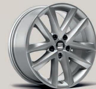
17" kola Dynamic