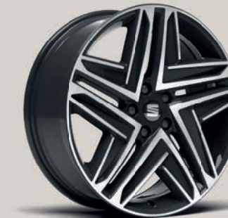
Broušená 19" kola Exclusive