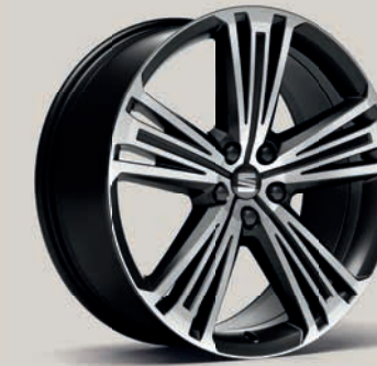
Broušená, matná 20" kola Supreme