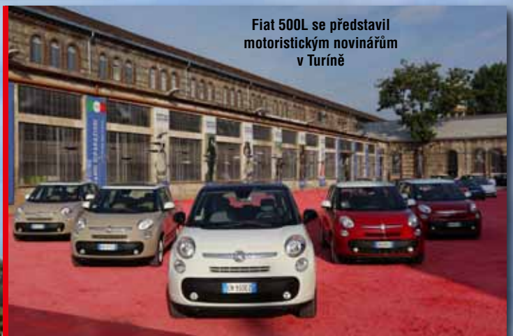
Fiat 500L se představil motoristickým novinářům v Turíně